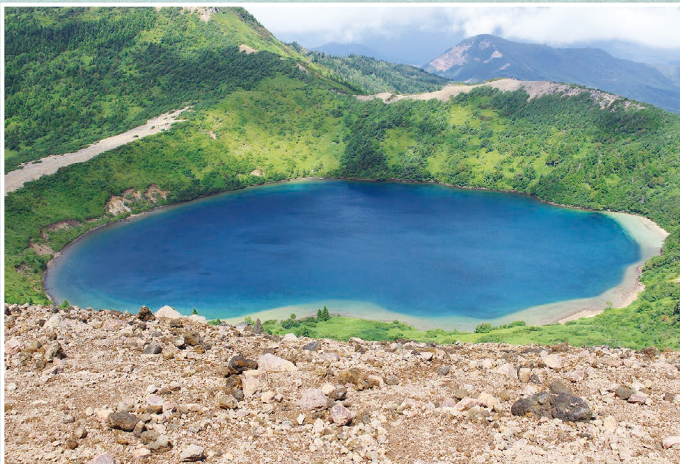
一切経山山頂から見る「魔女の瞳」