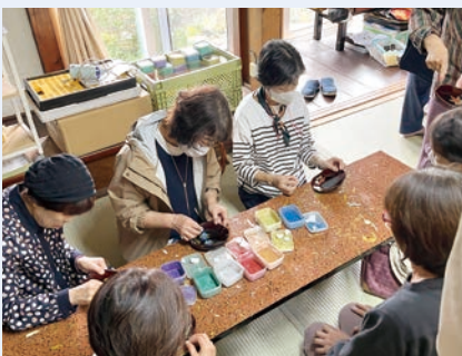
県中南・会津～絵付け体験