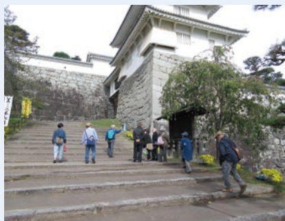
県北～霞ヶ城公園散策