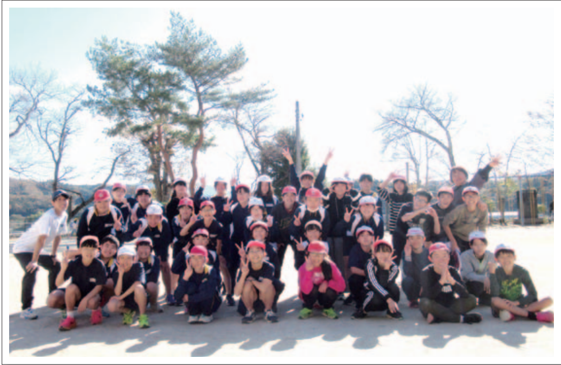
11月16日(木)に6年生だけの「ミニ運動会」を行いました。2クラス38名、全員がそろいました。卒業まで70日、よい思い出となりました。