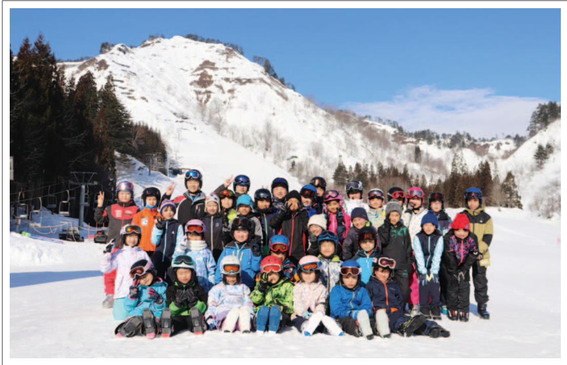
全校スキー教室の写真です。晴天の下、子どもたちは気持ちよくスキーを楽しみました。 只見町立只見小学校