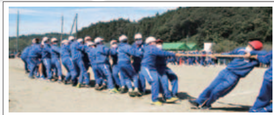
石川町立石川小学校 9月26日の運動会。青空のもとでの開催でした。 石川町立石川小学校