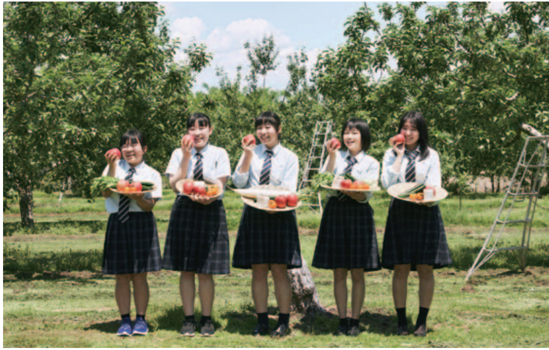
東京オリンピック・パラリンピック大会に、私たちが作ったグローバルGAP認証取得の農産物を提供しました。